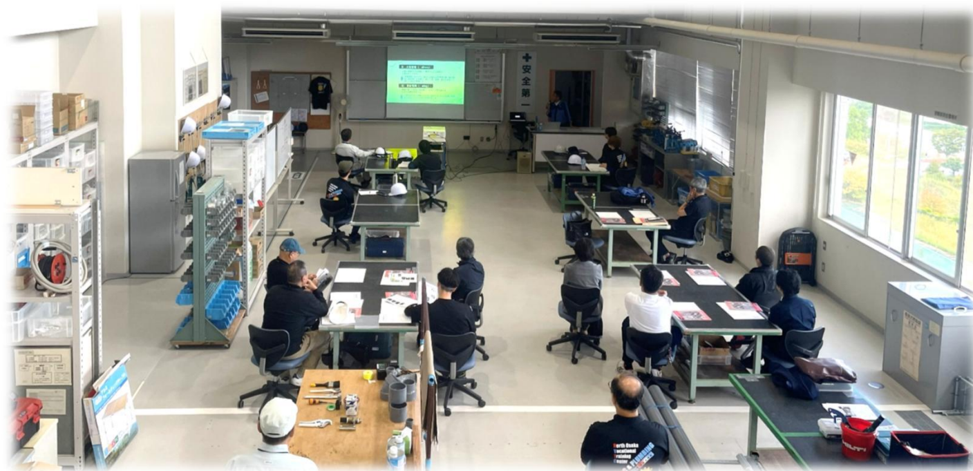
↑ 機械設備工事における施工管理についての講義 株式会社西原衛生工業所様 実施

「株式会社西原衛生工業所」様をはじめ、「株式会社三進」様、「協進断熱株式会社」様のご協力の元、北大阪技専校の実習場にて出前授業を実施していただきました。出前授業の内容として、「施工管理のお仕事」について講話をいただいたのち、「給排水天井配管実習」「断熱実習」を実施していただきました。実際に現場で働かれている方々から直接お話を聞ける非常によい機会となり、当科訓練生への業界理解の場としてレベルの高い訓練となりました。「設備業界」で活躍できる人材育成の第一歩として、今後も関連企業様とこのような場を共有していきたいと考えております。