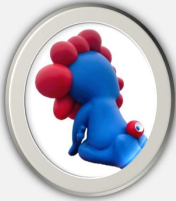
建築設備科 指導員