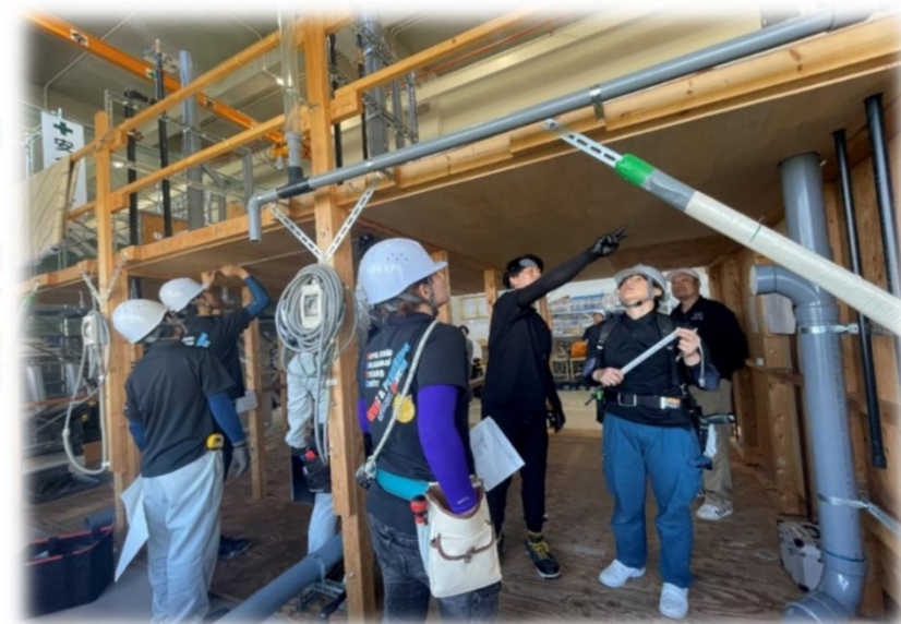
株式会社三進様 実施

→ 現場で活躍する職人さんからの的確なアドバイスをもらいながら、墨出し作業を進めます。