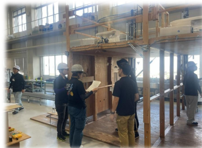
株式会社三進様 実施