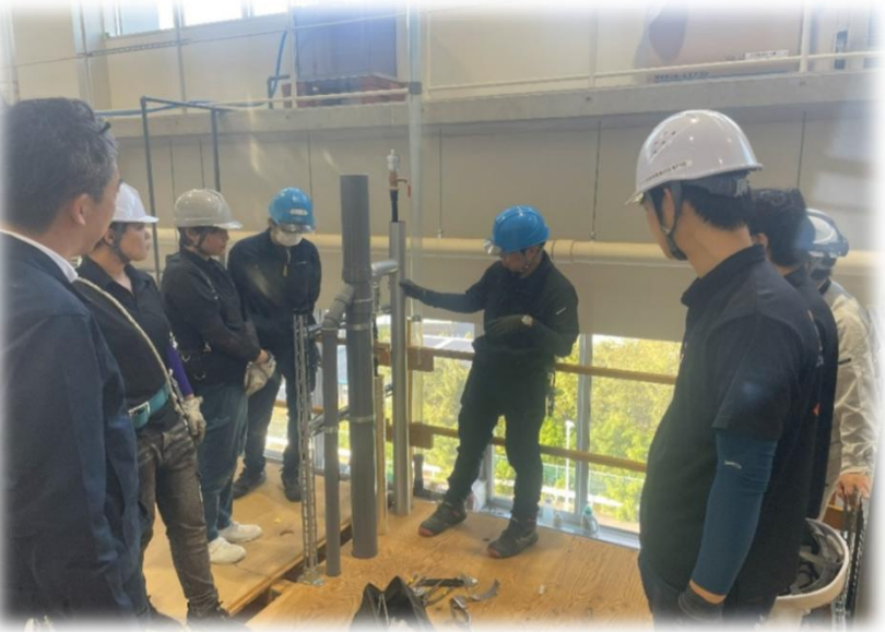
協進断熱株式会社様 実施

給水配管への断熱材施工→ 作成した保温材を保温用ハッカー を使用して、配管に取り付けてい きます。