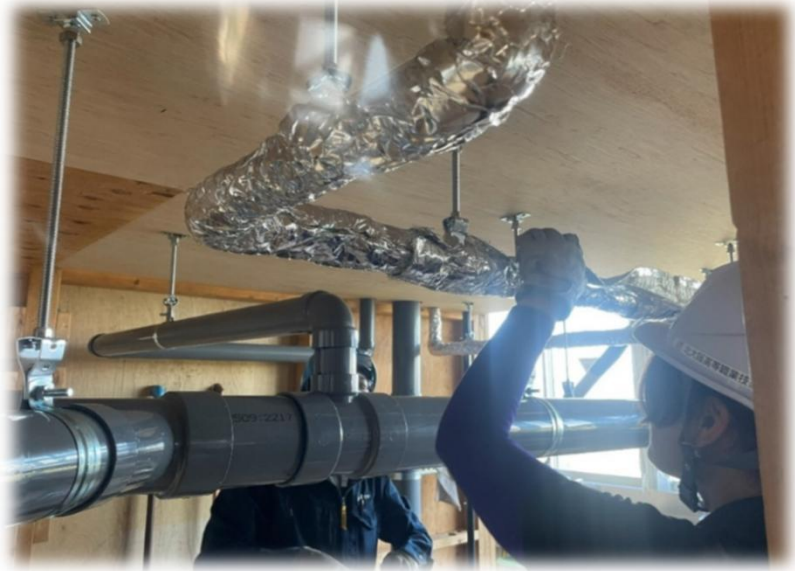
協進断熱株式会社様 実施

給水配管への断熱材施工→ 作成した保温材を保温用ハッカー を使用して、配管に取り付けてい きます。